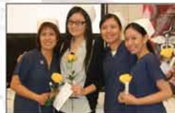
2002：加拿大博學學院成為第一個被批准開設職業護士(Practical Nursing)課程的私立學院。