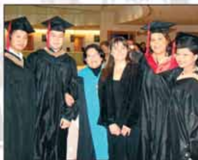
2004：加拿大博學大學學院開課。