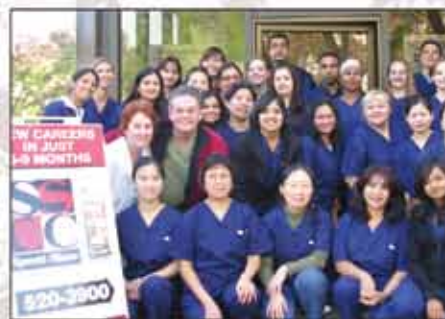
2007：加拿大博學學院成為英屬哥倫比亞省最大的家庭醫務護理(Resident Care Attendant)培訓機構之一。