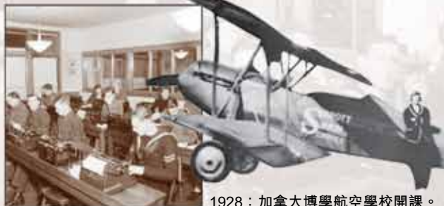
1928：加拿大博學航空學校開課。