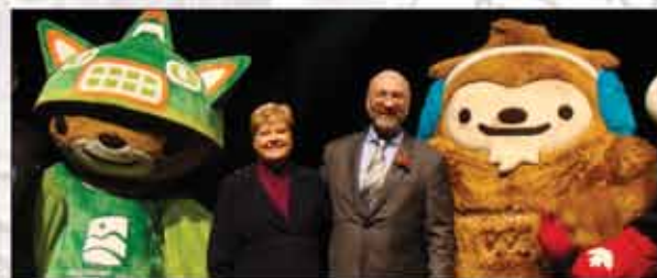
2010：成為2010年溫哥華冬奧會&殘奧會榮譽社區貢獻者。