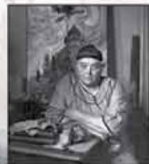
1930：世界著名藝術家Emily Carr從加拿大博學學院畢業。