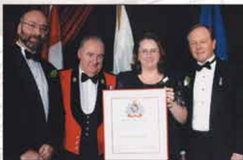
2003:加拿大博學學院被納入英屬哥倫比亞商業名人堂(British Columbia Business Hall of Fame)成員。