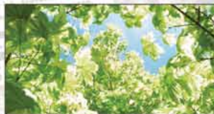
2009：加拿大博學學院自豪地以提倡低碳學習的方式為環保出力。每年為生態環境減少超過300,000公斤的碳排放量。