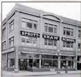
1903：加拿大博學商學院成立。