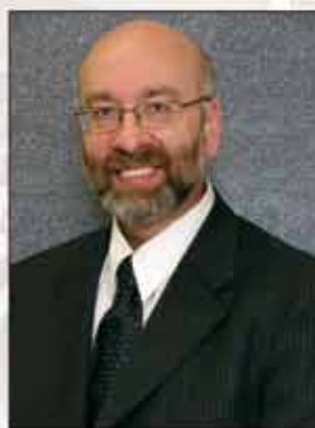
1991：加拿大博學學院在Dean Duperron和Sherri Duperron的領導下開始了真正的發展。