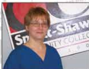
2008：加拿大博學學院成為加拿大最大的職業護士(Practical Nursing)培訓機構。