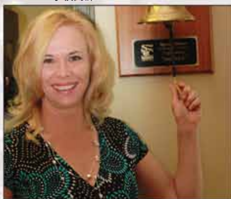
延續百年的傳統！加拿大博學學院的畢業生在成功就業後返回母校，以“拉鈴”的方式與他們的同學，老師，和校長分享成功的喜悅。